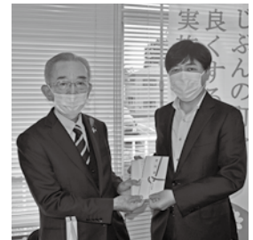
令和3年10月28日 (株)三宅商事様